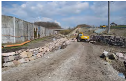
Construction du bassin du dessableur

Aménagement d'un dessableur sur le ruisseau du Moulin et adaptation du dessableur sur le ruisseau du Dy.