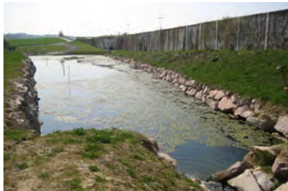
Dessableur sur le ruisseau du Moulin