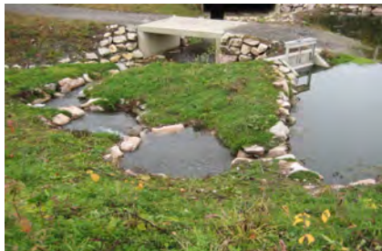
Aménagement d'une échelle à poissons