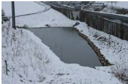
Situation du dessableur