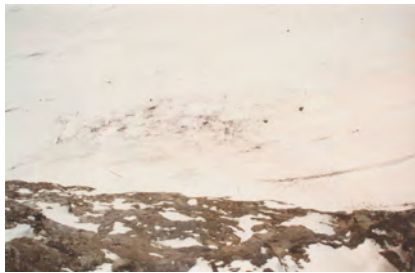
Schuttablagerung auf dem Gletscher