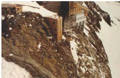
Treppenturm und betroffener Felshang

Ausbau der 2. Bahnhofshalle auf dem Jungfraujoch: Beurteilung der Auswirkungen der geplanten Abschütterung des Aushubmaterials auf Fauna, Flora und Landschaft.