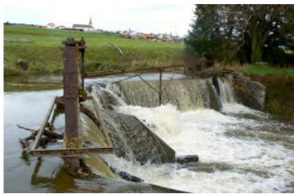
Sanierungspflichtiges Hindernis (FR)