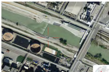
Fischpass Wysswasser (VS)

Unterstützung der Kantone bei den strategischen Planungen für die Wiederherstellung der freien Fischwanderung bei wasserkraftwerksbedingten Hindernissen in den Kantonen Freiburg und Wallis mit Koordination der nicht-wasserkraftbedingten Hindernissen im Rahmen von Revitalisierungsprojekten.