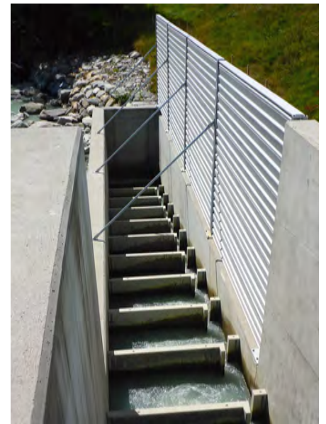
Fischpass Wysswasser (VS)