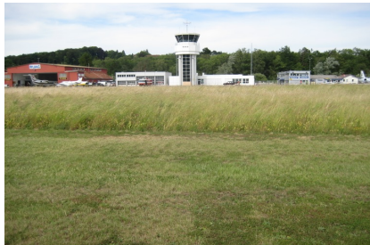
Wenig intensive genutzte Wiese