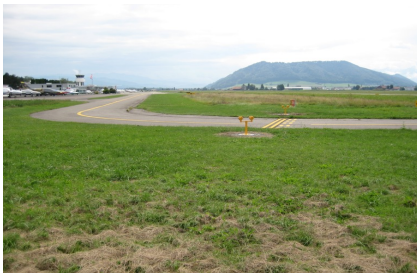
Freihalteflächen beim Rollweg

Realisierung des ökologischen Ausgleichs auf dem Flugplatz.