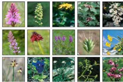
Analyse de la biodiversité (Flore)