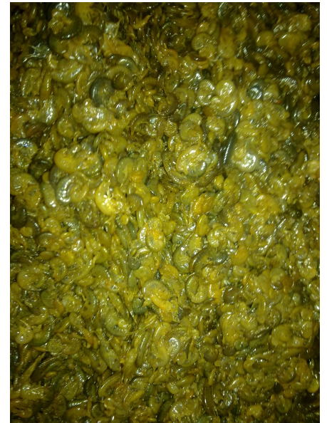
Prélèvements de gammares