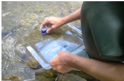
Nettoyage du biofilm sur les capteurs