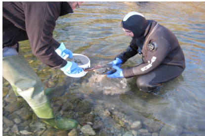
Tamissage des sédiments