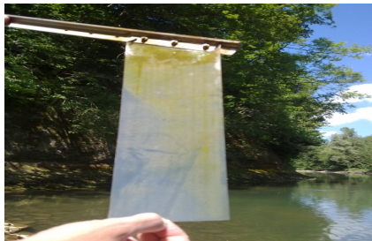
Capteurs passifs simples

Suivi de la pollution par les PCB dans la Sarine à l'aide des indicateurs sédiments, invertébrés benthiques et capteurs passifs.