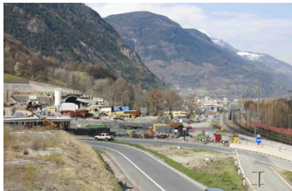
Dreiviertelanschluss Visp Ost