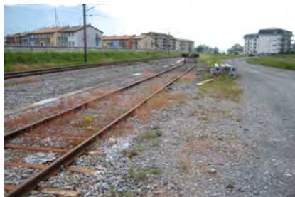
Lieu de manutention au Bouveret