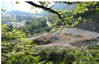
Décharge du Châtelet

Comparaison des émissions entre différentes variantes du transport des scories entre la SATOM et la décharge du Châtelet.