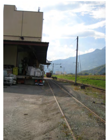
Lieu de manutention au Landi